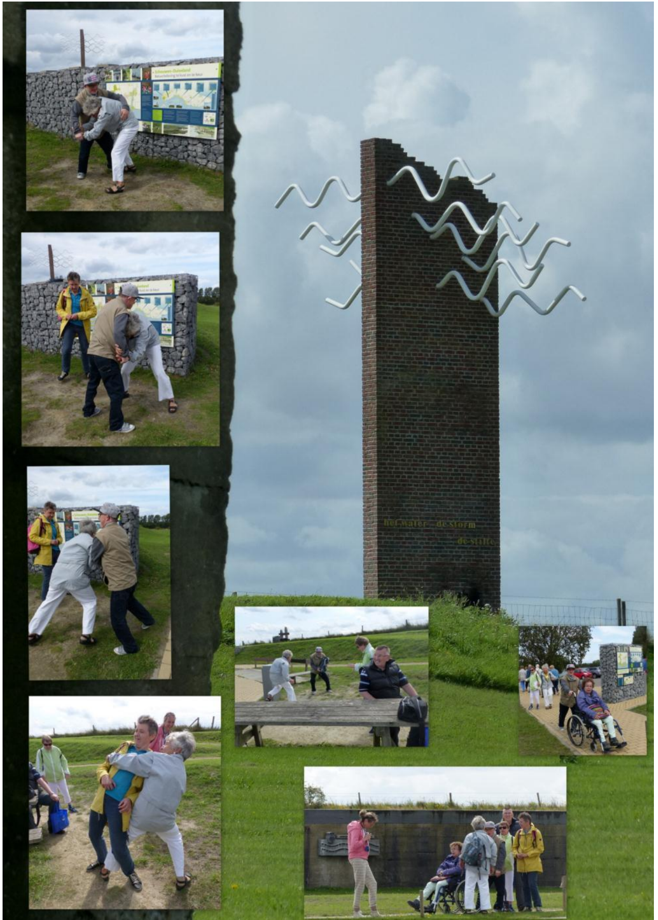
Op de terugweg doen we wat boodschappen in Burgh-Haamstede, zien we dat plaatsje ook